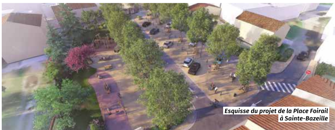
Esquisse du projet de la Place Foirail à Sainte-Bazeille

Depuis l'an dernier, dans le cadre de son plan de végétalisation, l'Agglo a décidé de soutenir techniquement et financièrement les communes dans leurs projets de renaturation des espaces publics.