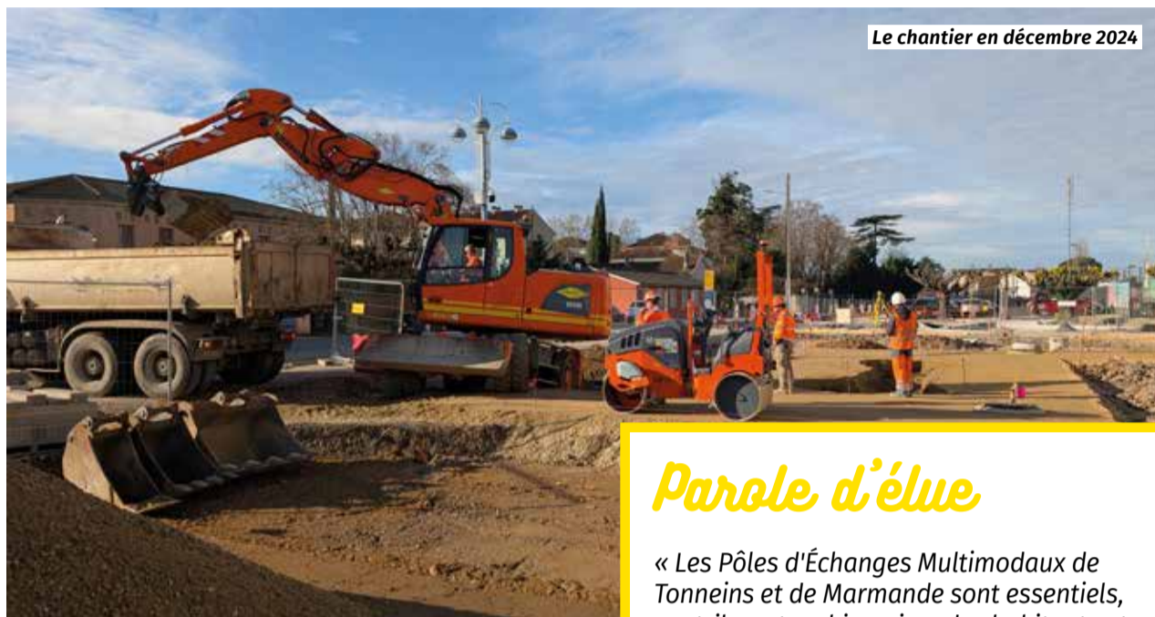
Le chantier en décembre 2024

Exclusivement réservé aux modes de déplacements actifs (piétons, vélos...), le parvis de la gare sera largement végétalisé tout comme l'ensemble du site. En tout ce sont 56 arbres qui seront présents contre 9 auparavant, sans compter les nombreux arbustes et massifs. Le vélo tiendra une place importante avec l'aménagement d'une piste cyclable qui sera, à court terme, raccordée à la liaison cyclable prévue en 2026 vers le collège Germillac. Des box-vélos sécurisés seront également installés sur le parvis.