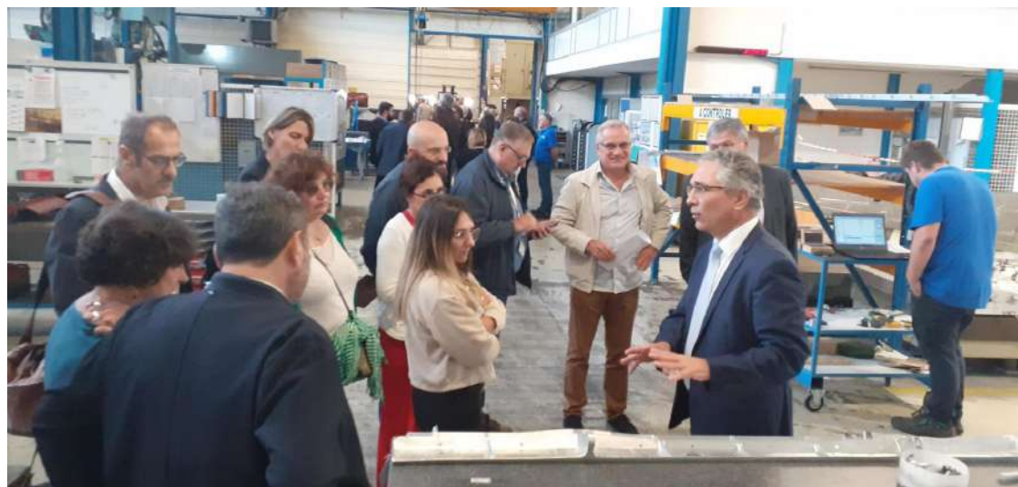
Rencontre du Comité Local Ecole Entreprise, sept. 2023

« Le CLEE est un outil qui nous permet de mettre en relation deux mondes parallèles mais qui ne se connaissent pas assez : l'école et l'entreprise. L'objectif est de mieux se comprendre et d'avancer ensemble. Les entreprises locales ont de gros enjeux de recrutement donc l'orientation des élèves est essentielle. Nos défis sont de montrer la multitude de métiers dans les entreprises, adapter notre offre de formation au tissu local et notamment dans les filières techniques et l'industrie qui a un vrai besoin de main d'œuvre qualifiée. Nous organisons des visites d'entreprise pour nos élèves et professeurs, nous valorisons les stages d'observation afin de donner envie aux jeunes de poursuivre sur des voies qui recrutent. D'ailleurs, au CLEE, nous travaillons sur un annuaire des entreprises accueillantes et sur des actions sur l'accueil des stagiaires. »