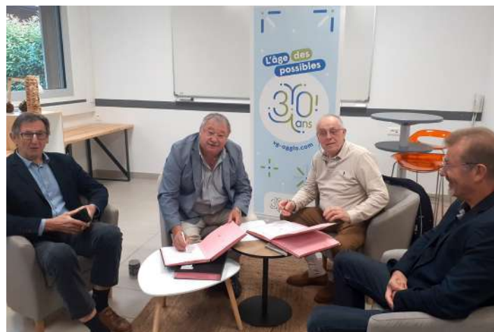
Signature convention avec la CMA, mai 2024

Notre coopération se situe notamment dans le développement des échanges et des relations d'affaires entre les acteurs économiques locaux ou extérieurs. Une qualité des échanges déjà constatée lors de plusieurs événements organisés en partenariat »