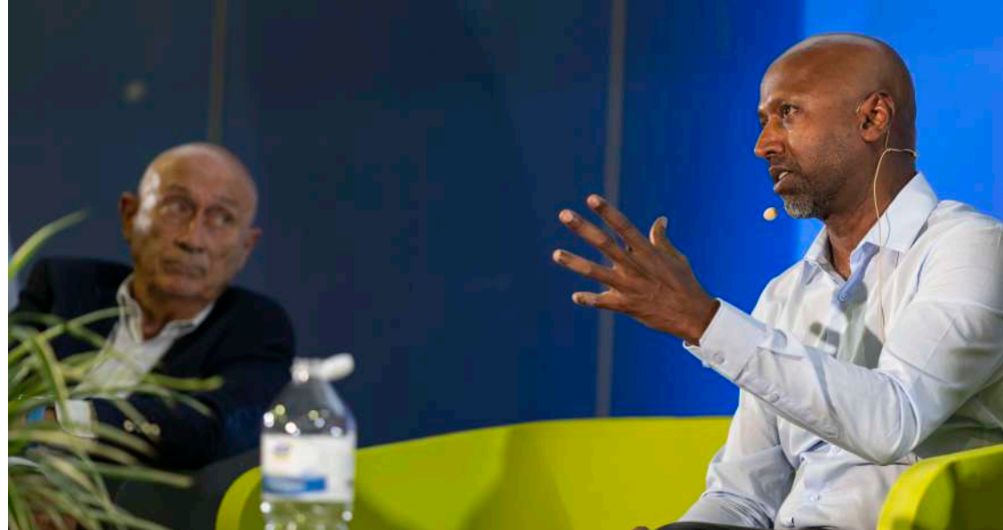
Intervention de Navi Radjou, Forum des Transitions, sept. 2024