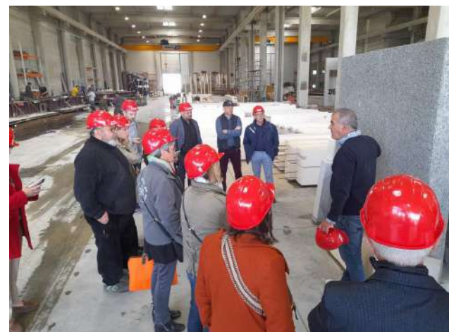
Lancement de la démarche de structuration d'un pôle d'excellence territorial De Lorenzo BTP, mai 2024

« Éco-construction et éco-rénovation font partie de notre identité et de notre philosophie. Sur la décarbonation, nous faisons le choix au maximum de matériaux biosourcés comme la fibre de bois ou encore la paille hachée (hachage en circuit court à moins de 50 km du lieu de production). Par exemple, nous sommes en train de réaliser un mur en bottes de paille pour un gymnase du Centre-Val de Loire. Pour nous, éco-construire et éco-rénover, c'est travailler avec l'ensemble des autres corps et entreprises du territoire, c'est travailler avec les architectes en amont pour atteindre des coûts raisonnables, c'est produire hors site afin de permettre une intégration des différents corps de métiers en usine, et bien sûr c'est prendre en compte le confort d'été dans les logements. »