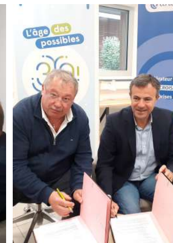
Signature convention avec la CCI, avril 2024