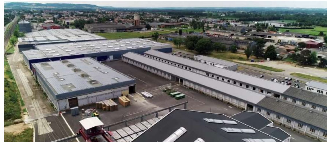
Parc d'activité André Thevet, Tonneins.

« Traditab valorise la production régionale de tabac en particulier par la création et la commercialisation de produits finis. Nous sommes en France la seule PME de ce secteur d'activité dominé par des multinationales. Après avoir bénéficié d'un hébergement en pépinière d'entreprises, il nous semblait logique de nous installer à Tonneins. La reprise d'une partie des bâtiments de l'ancienne SEITA est symboliquement forte pour nous. Au-delà de notre site administratif, nous avons installé notre laboratoire et louons par ailleurs l'un des halls de 2000 m 2 pour procéder à l'achat du tabac aux producteurs. Nous avons réalisé depuis deux ans le bilan carbone de notre société, et la réhabilitation de bâtiments existants permet de limiter notre empreinte tout en bénéficiant de locaux fonctionnels. Enfin, cette installation sur la zone André Thevet nous a permis la proximité avec d'autres entreprises dynamiques installées sur le site. »